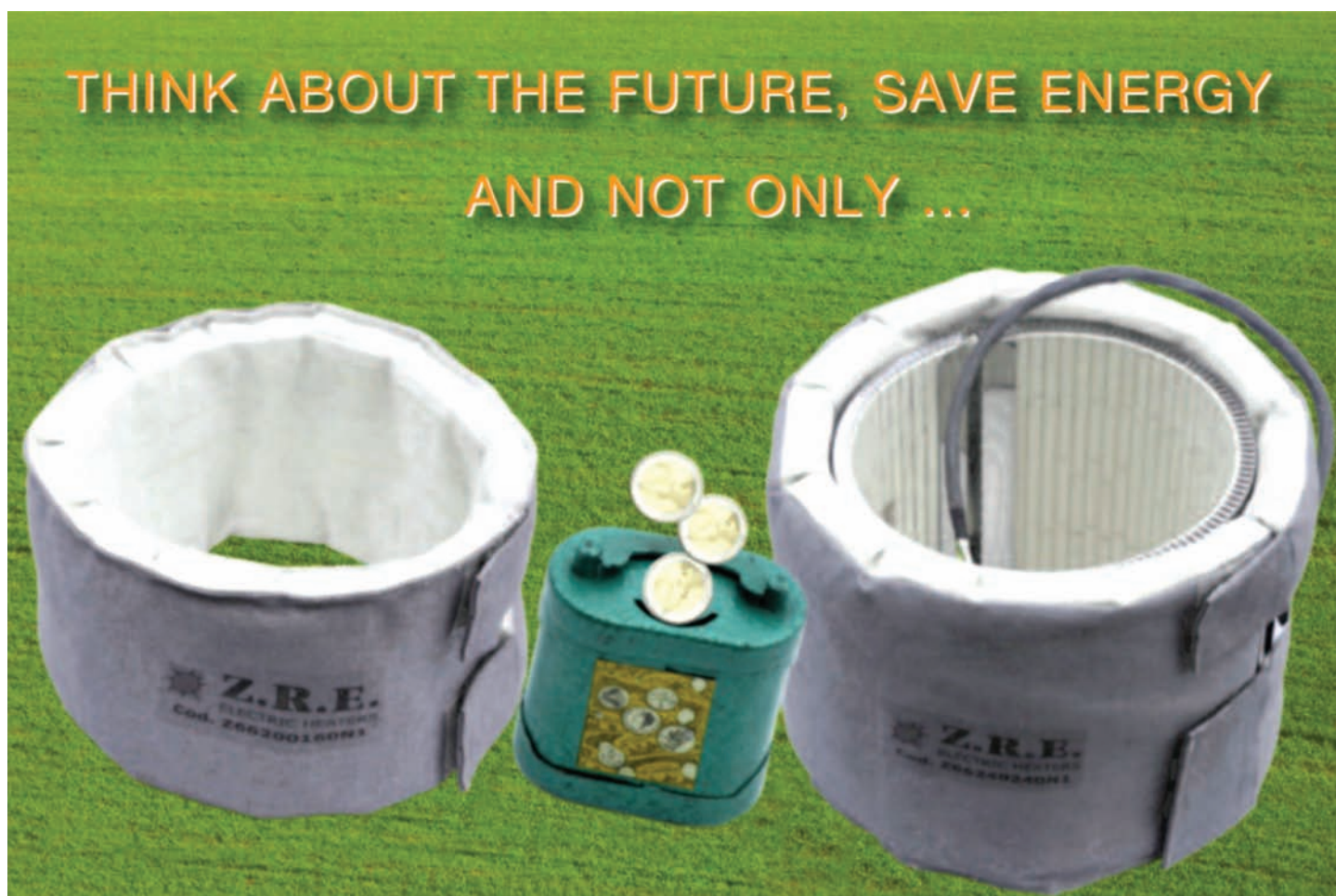
MODEL Z.66 (ISOCOAT)